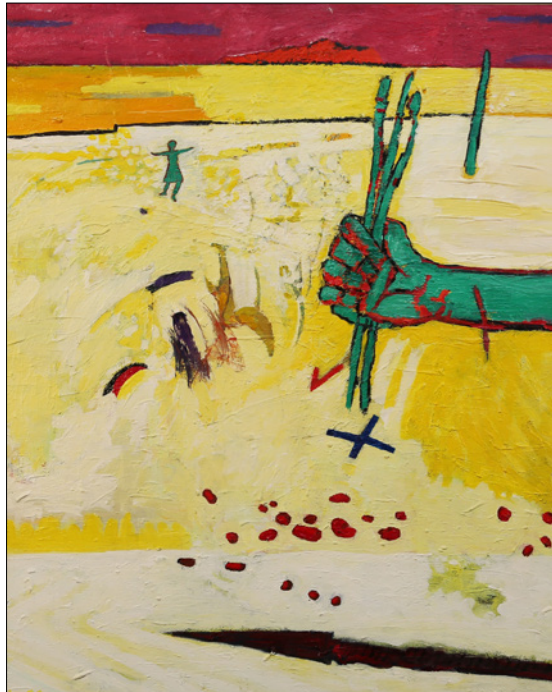
Sorgrejse Kosovo Jes Schrøder

Der bliver tale om 8 mandage i 2018, hvor oplægsholderne lader sig inspirere af billedsprogets eventyrlige kraft.