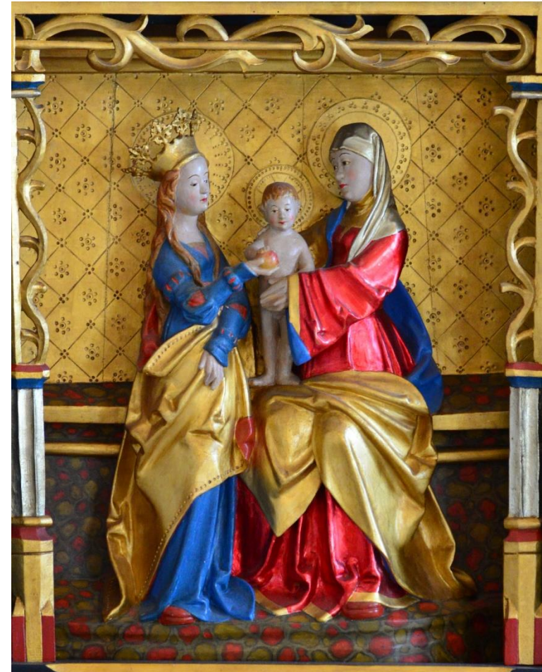
Anna Selvtredje, udsnit af Løjt kirkes altertavle