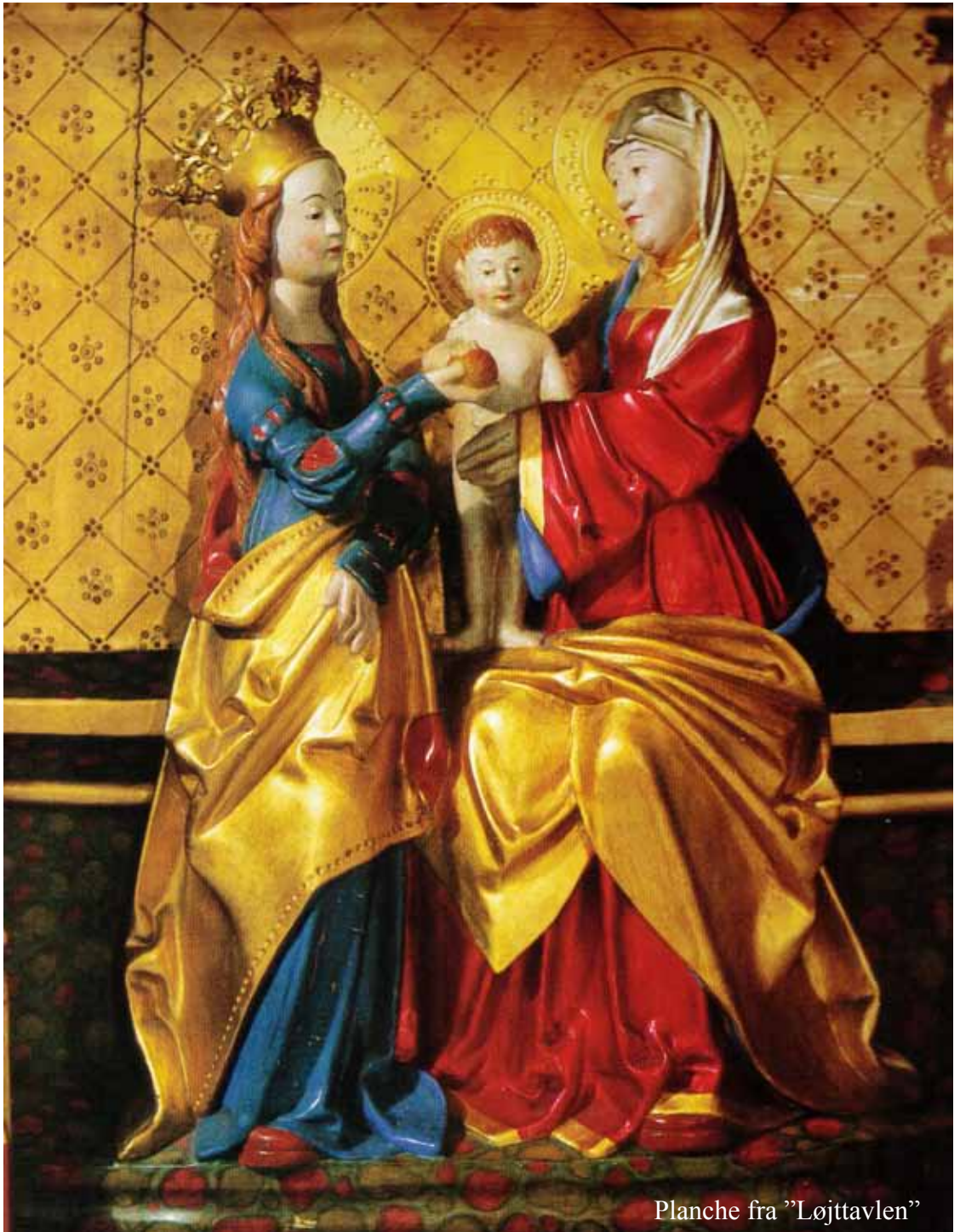
Planche fra "Løjttavlen"