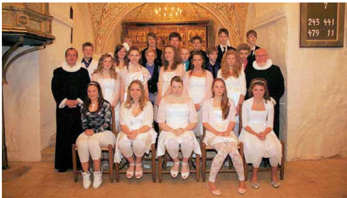
Konfirmeret den 11. april 2010