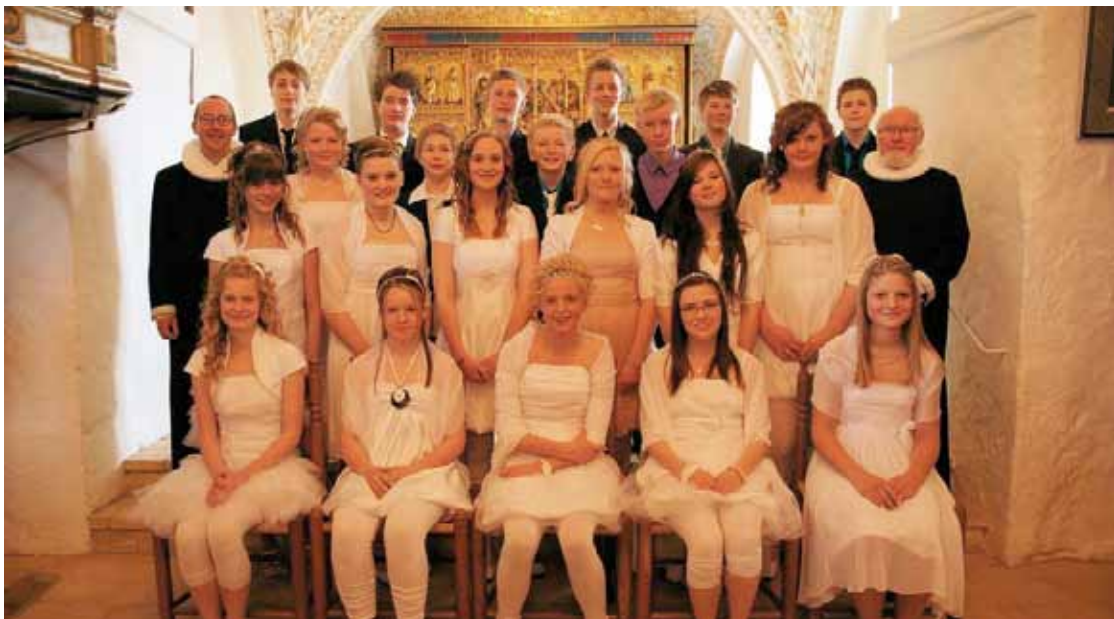
Konfirmeret den 18. april 2010